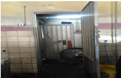
Foto No. 3. Cuarto de maquinas