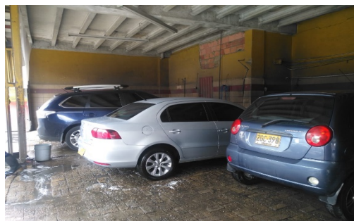
Foto No. 2. Zonas de lavado