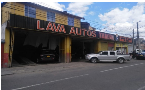
Foto No. 1. Fachada del establecimiento Autolavado Tabora