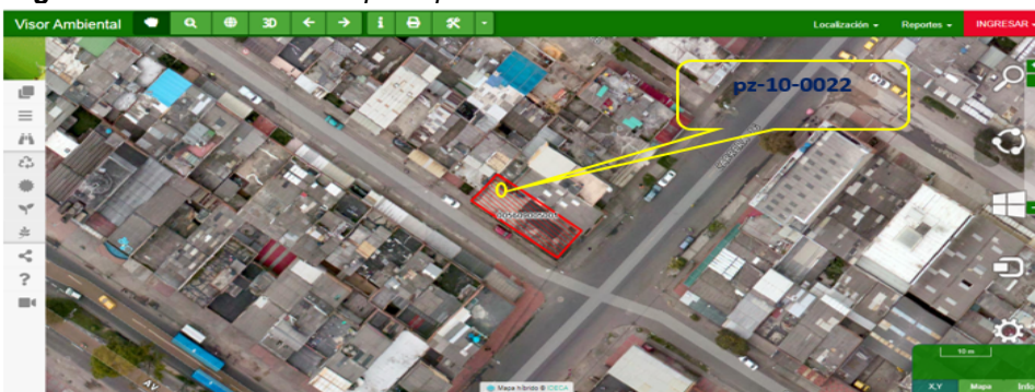
Imagen No. 2. Ubicación del pozo pz-10-0022

Mediante la herramienta Visor Ambiental se identifica que el pozo pz-10-0022, No se encuentra afectado por zona de manejo y preservación ambiental, corredor ecológico, ni ronda hídrica, según lo establecido en el Decreto 190 de 2004, modificado por la Resolución 228 de 2015 en la cual se precisa el límite del perímetro urbano y se dictan otras disposiciones.